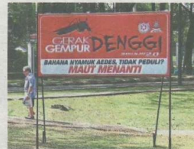
A signboard advising the public to beware of dengue.