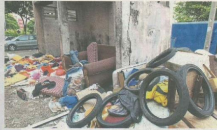
Indiscriminately dumped rubbish often becomes breeding grounds for Aedes mosquitoes. Dr Daroyah said resident should to clean up their surroundings to eradicate potential breeding sites.