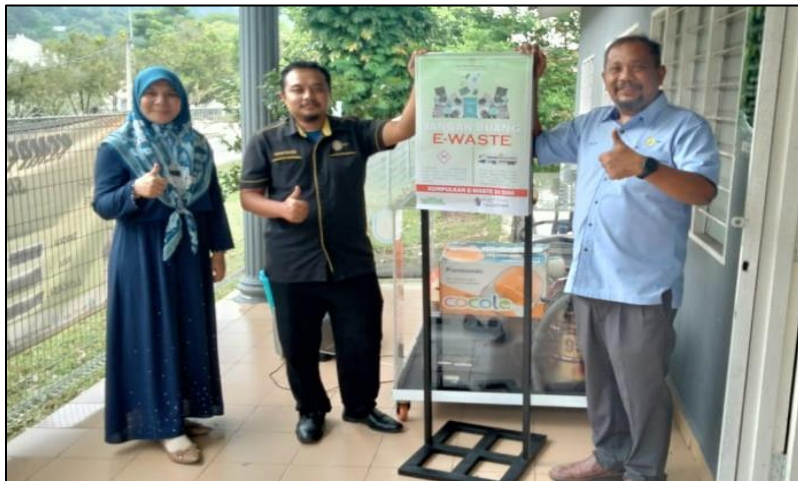
GAMBAR DALAM PREMIS