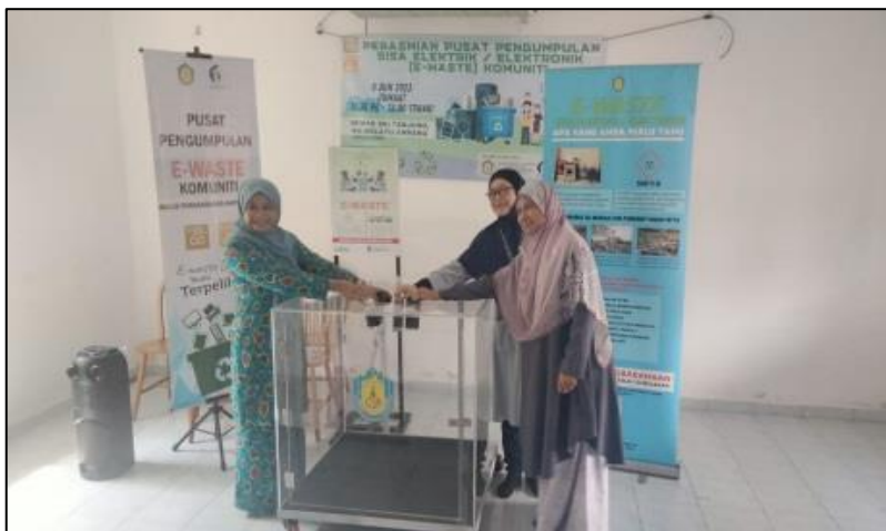
GAMBAR DALAM PREMIS