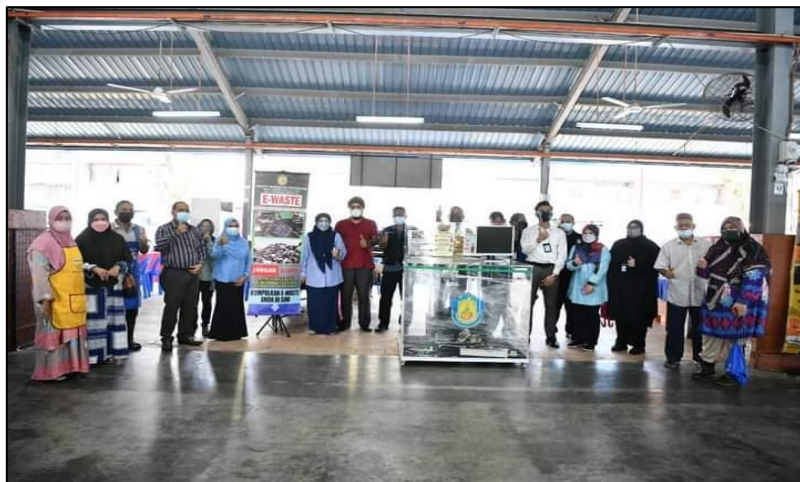
GAMBAR DALAM PREMIS