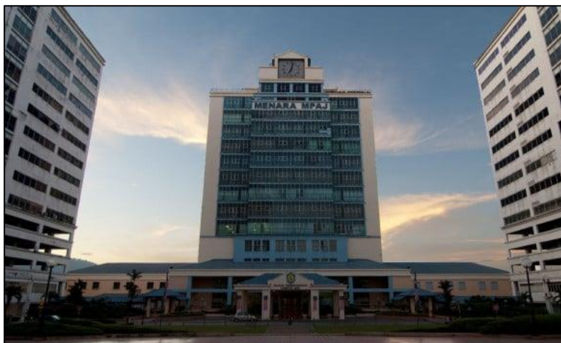
GAMBAR LUAR PREMIS