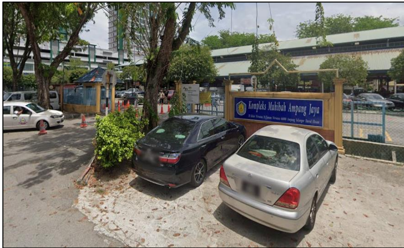
GAMBAR LUAR PREMIS