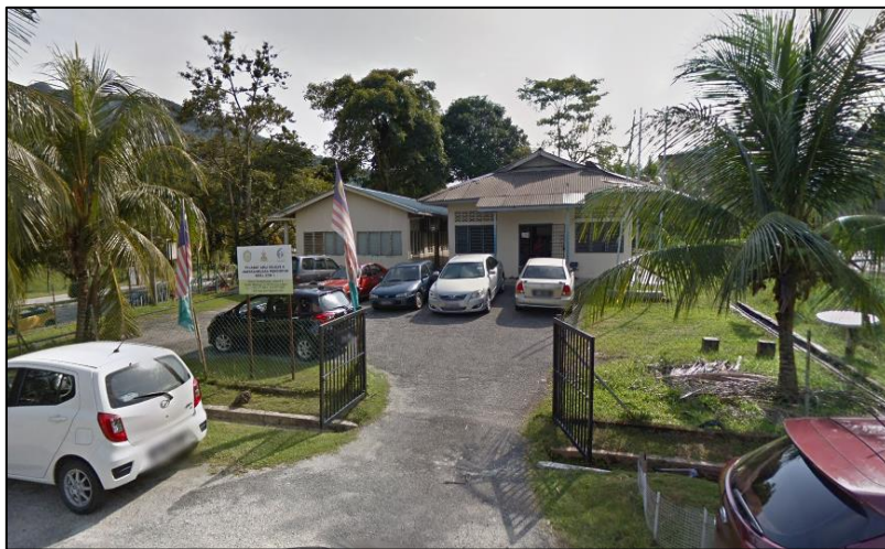
GAMBAR LUAR PREMIS