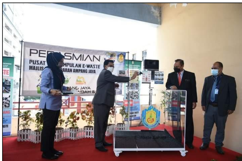
GAMBAR DALAM PREMIS