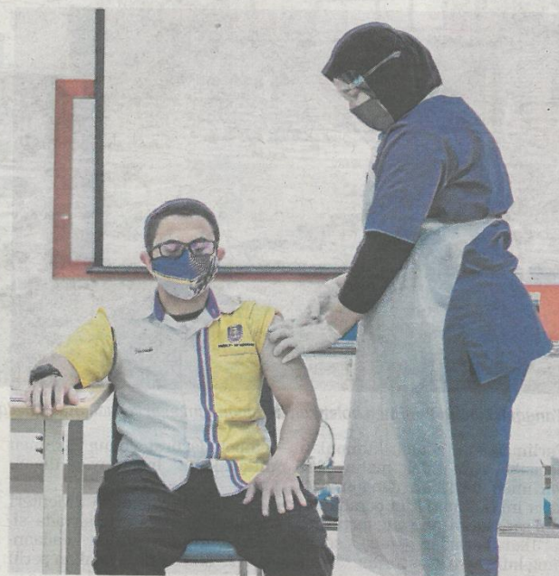
Petugas kesihatan melakukan suntikan vaksin Pfizer BioNtech pada seorang kakitangan Hospital UiTM, Sungai Buloh, semalam.

Turut dikesan satu kluster membabitkan pusat jagaan warga emas, iaitu Kluster Jalan Anak Gasing di Petaling, Selangor,