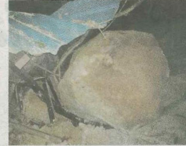
Bongkah batu terjatuh memusnahkan garaj.

Penolong Pengarah (Operasi) Jabatan Bomba dan Penyelamat Malaysia (JBPM)