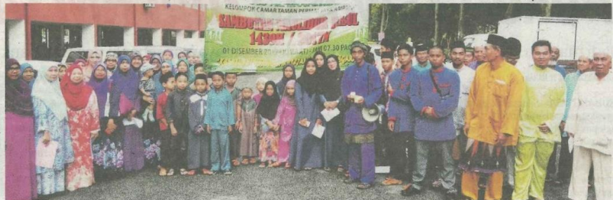
Sebahagian warga Flat Kelompok Camar bergambar sebelum berarak sempena sambutan itu semalam.

Katanya, sambutan Maulidur Rasul yang diadakan itu juga dapat menunjukkan komitmen orang ramai untuk menjunjung kesepaduan dan kesatuan umat Islam.