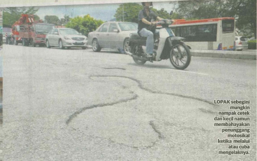
LOPAK sebegini mungkin nampak kecil dan kecil namun membahayakan penunggang motosikal ketika melalui atau cuba mengelaknya.