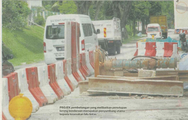
PROJEK pembetulan yang melibatkan penutupan lorong kenderaan merupakan penyumbang utama kepada kesesakan lalu lintas.