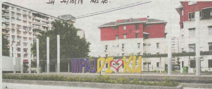
Kerja naik taraf laluan pejalan kaki berbumbung dan seni bina landskap akan dilaksanakan di Dataran Transit MPAJ.

Beliau berkata, masyarakat juga boleh melakukan aktiviti harian dengan berjalan kaki di mana situ modul kejiranan hijau direka bentuk dalam skala lima minit berjalan kaki dengan radius 400