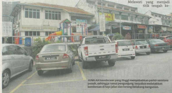
JUMLAH kenderaan yang tinggi menyebabkan parkir sentasa penuh, sehingga ramai pengunjung terpaksa meletakkan kenderaan di tepi jalan dan lorong belakang bangunan.

Kehijauan dan udara bersih Taman Melawati yang terletak di kaki bukit dan terpinggir dari hiruk-pikuk bandar itu tidak lagi mampu dinikmati penduduknya ekoran dihabat pembangunan projek-projek mega.