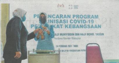
Petugas kesihatan membuat persiapan akhir pelaksanaan suntikan vaksin COVID-19 di Pusat Kesihatan Wilayah Persekutuan, Putrajaya semalam.