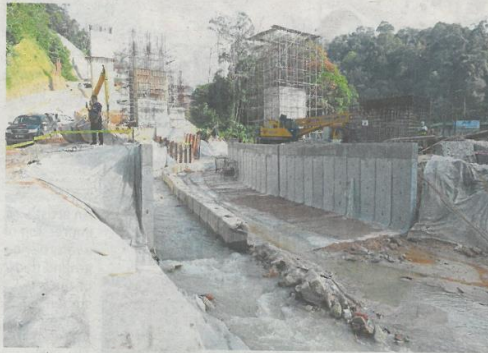
Geotextile is used at the EKVE project site to protect the soil.

State authorities will monitor measures taken at projects near water sources