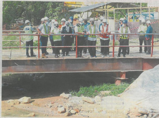
Hee visiting the EKVE project site near the Ampang water treatment plant with representatives of the state DOE, Luas as well as project owner and contractor.

By VIJENTHI NAIR vijenthi@thestar.com.my