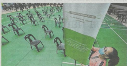
Petugas kesihatan melakukan persiapan fasa pertama program imunisasi COVID-19 di Stadium Perpaduan Negeri Petra Jaya, Kuching, semalam.

Terdapat empat Pusat Simpanan Vaksin (PSV) diwartakan di Johor dengan 54 lagi adalah Pusat Pemberian Vaksin (PPV).