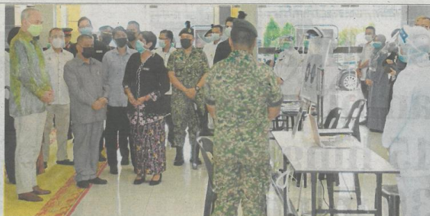
Sultan Nazrin berangkat ke Pusat Penerimaan Vaksin melihat persiapan kelengkapan dan fasiliti Program Imunisasi COVID-19 Kebangsaan di Stadium Indera Mulia, Ipoh, semalam.

Di Ayer Keroh, Ketua Menteri, Datuk Seri Sulaiman Md Ali, berkata Melaka menerima 600,000 dos vaksin Pfizer-BioNTech mulai hari ini.