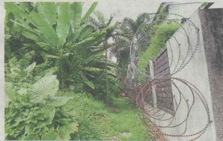
Some homeowners put up barbed wires around their property to deter animals from entering their compounds.