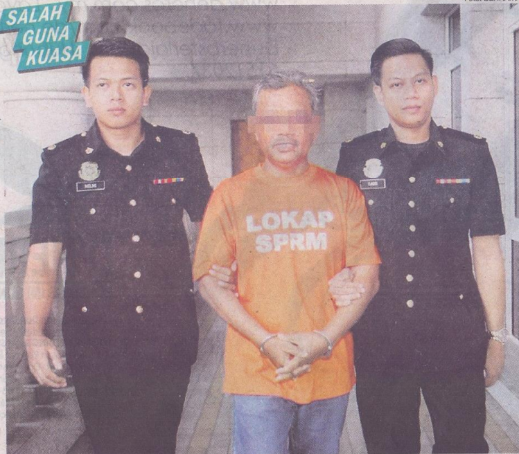
Pengurus besar sebuah agensi kerajaan dibawa ke Mahkamah Majistret Putrajaya, semalam.