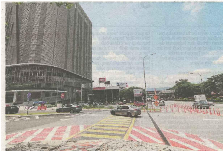
Susur masuk utama ke Taman Melawati dari Lebuhraya Lingkaran Tengah 2 (MRR2), yang didakwa menimbulkan kesulitan dan berbahaya kepada penduduk.