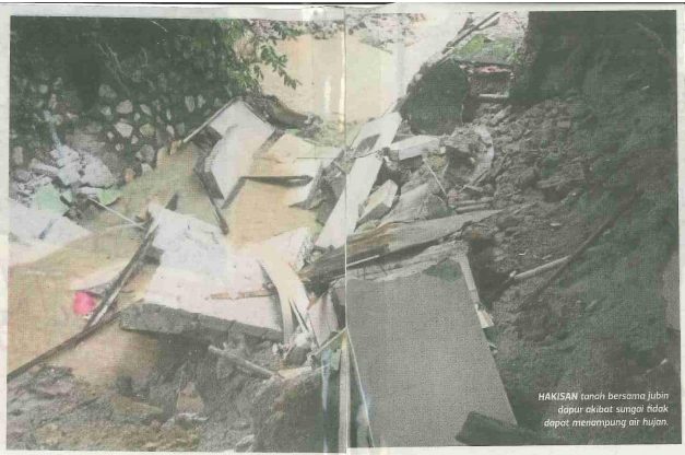
HAKISAN tanah bersama jubin dapur akibat sungai tidak dapat menampung air hujan.