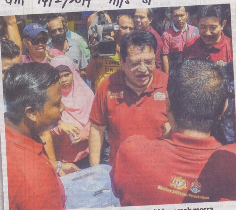
TENGGU ADNAN TENGGU MANSOR (tengah) beramah mesra bersama penduduk pada program Kenduri 1Wilayah Persekutuan Parlimen Titiwangsa di Taman Maluri, Kuala Lumpur, kelmarin.