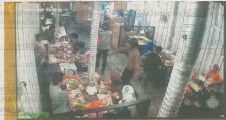
KELIHATAN dua perompak yang memasuki restoran di Ampang Jaya dan merampas beg tangan pelanggan.

Berdasarkan CCTV berdurasi satu minit empat saat, sebelum kejadian rompakan, dilihat pelanggan leka dengan sajian masing-masing dengan dua