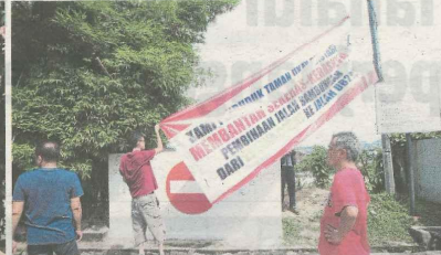
Penduduk Taman Ukay Bistari membina tembok bagi membantah pembinaan laluan pintas di taman perumahan mereka.