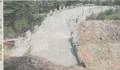
Laluan pintas yang dibina ke sebuah kondominium dibimbangi menambahkan lagi kesesakan di Taman Ukay Bistari.