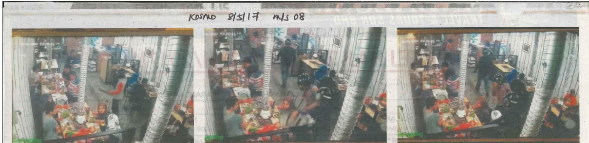
AKSI-AKSI empat perompak bersenjata parang melakukan rompakan ke atas pelanggan yang sedang menjamu selera di sebuah restoran di Ampang Jaya malam kelmarin dan tular di laman sosial.