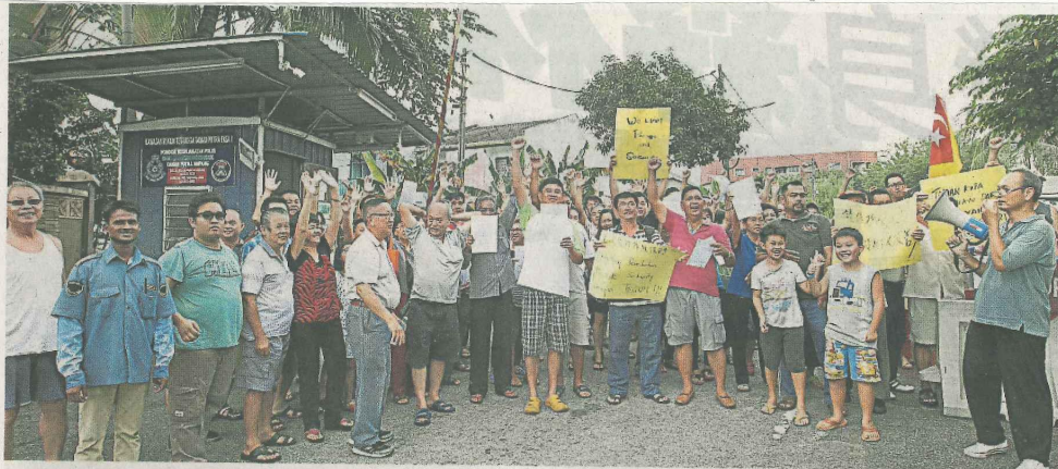
▲逾200名安邦丽华镇居民希望保留保安亭，以保卫家园治安。