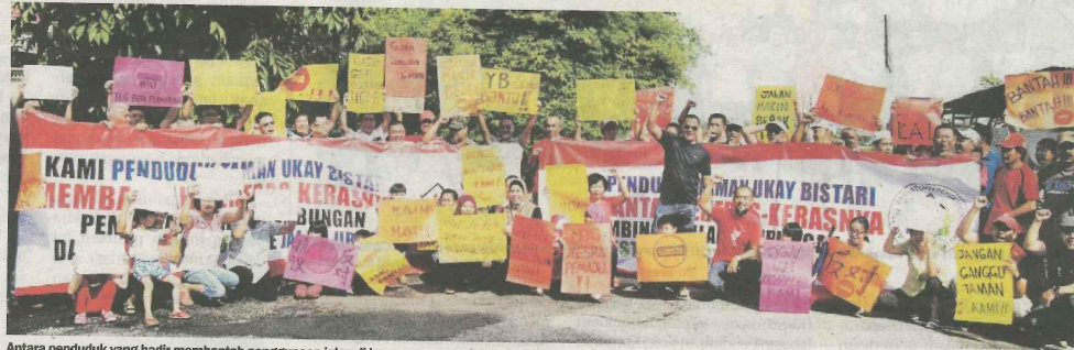
Antara penduduk yang hadir membantah penggunaan jalan di kawasan perumahan mereka.