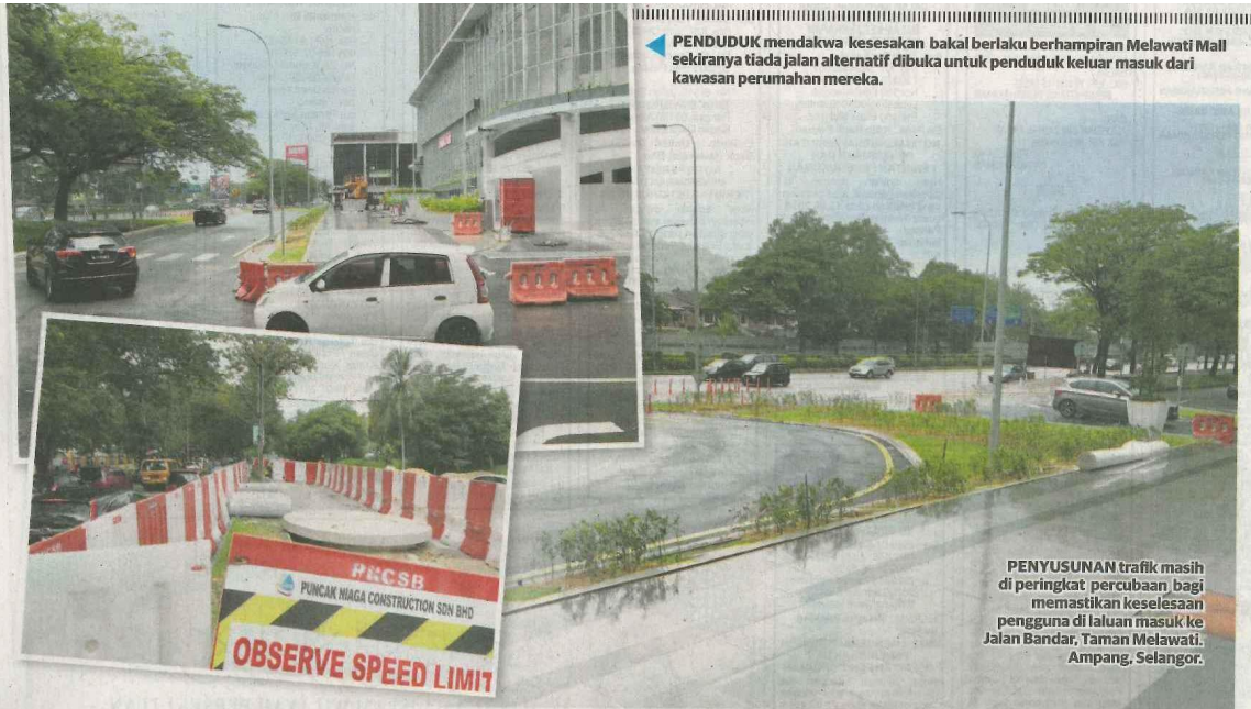
▶ PENDUDUK mendakwa kesesakan bakal berlaku berhampiran Melawati Mall sekiranya tiada jalan alternatif dibuka untuk penduduk keluar masuk dari kawasan perumahan mereka.