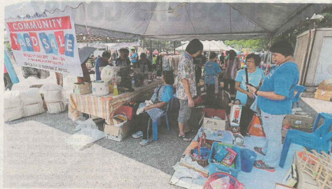
Pelbagai barangan terpakai dijual oleh penduduk yang menjayakan program kitar semula.