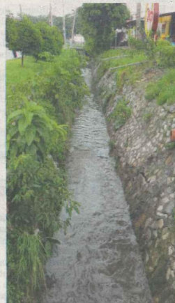
KEADAAN longkang yang kecil di Jalan Ampang Putra tidak mampu menampung air ketika hujan lebat.

"Bantuan atau sagu hati akan diberi kepada penduduk terbabit bagi meringankan beban mereka," ujarnya.