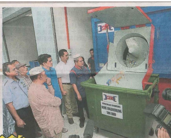
■拥有垃圾压缩机的瓜拉安邦巴刹，整体卫生获得显著改善。