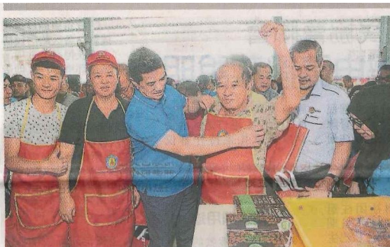
■阿兹敏阿里（左3）为小贩穿上围裙。