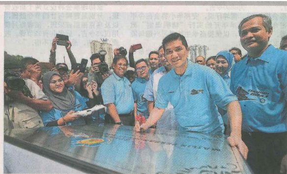
■阿兹敏阿里(右2)在嘉宾陪同下进行签名仪式。右起是阿都哈密、依斯干达、阿米鲁丁及莫哈末阿敏。