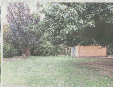
Kawasan belakang tandas awam Taman Tasik Datuk Keramat yang terencil dikuatiri jadi tempat aktiviti tidak sihat.