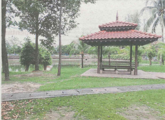
Satu daripada lima pondok rehat untuk kemudahan orang ramai di Taman Tasik Datuk Keramat, Kuala Lumpur.