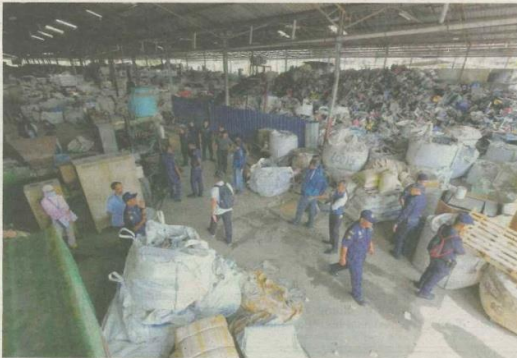
ANGGOTA penguat kuasa memeriksa sebuah kilang memproses sisa plastik dalam operasi bersepadu di Jenjarom, Kuala Langat semalam.