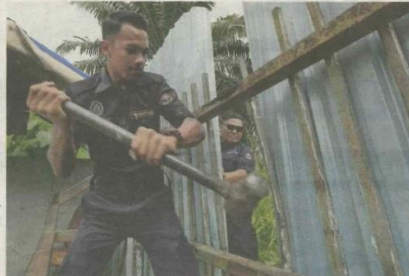
ANGGOTA penguat kuasa terpaksa menggunakan tukul besi memecahkan pintu zink selepas pemilik kilang kitar semula di Jenjarom, Kuala Langat enggan membuka pintu.

juga akan memantau operasi kilang berlesen bagi memastikan mereka beroperasi mengikut prosedur operasi standard (SOP)," jelasnya.