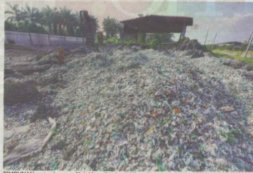
TIMBUNAN sampah yang diletakkan di sebuah kilang kitar semula di Jalan Klang-Banting di Kuala Langat yang mencetuskan kebimbangan penduduk daerah itu.

Katanya, pemohon AP sisa plastik bertarif HS Kod 3915 perlu melepasi kriteria ketat dikenakan Jabatan Pengurusan Sisa Pejal Negara (JPSPN) selain pengimport juga perlu mendapatkan surat kelulusan pematuhan kilang daripada Jabatan Alam Seki-