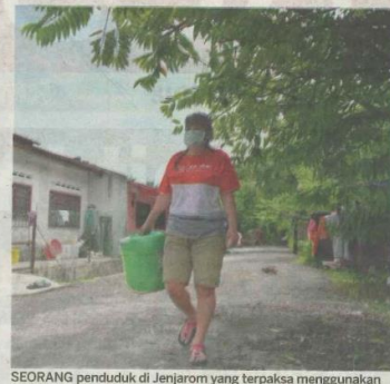
SEORANG penduduk di Jerjarom yang terpaksa menggunakan topeng mulut bagi mengatasi masalah pencemaran udara akibat operasi kilang kitar semula yang memproses sisa plastik.

tar (JAS) dan mempunyai lesen premis PBT.