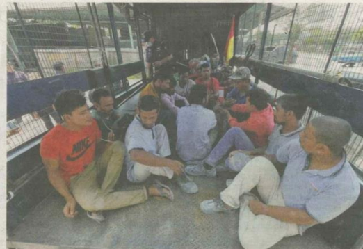
SEBAHAGIAN daripada pekerja warga asing yang ditahan dalam operasi di kilang kitar semula di Jenjarom, Kuala Langat.