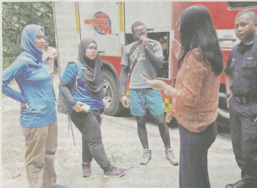
Mangsa ditemukan selamat kira-kira jam 1.50 petang, semalam.

"Mangsa dua wanita tempatan dan seorang lelaki warga Afrika diserahkan kepada polis untuk tindakan selanjutnya," katanya.