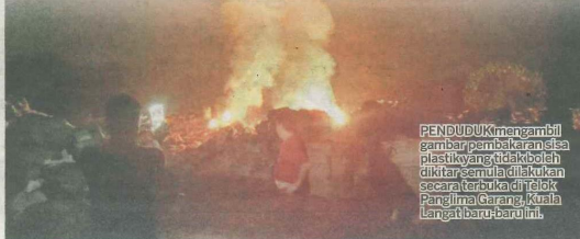
PENDUDUK mengambil gambar pembakaran sisa plastik yang tidak boleh dikitar semula di kawasan secara terbuka di Telok Panglima Garang, Kuala Langat baru-baru ini.