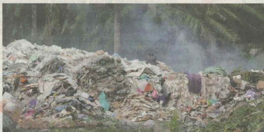
TAPAK pembakaran plastik haram yang ditemui dalam tinjauan Kosmo! di Kuala Langat semalam.

"Saya bersemitu membenarkan lori tersebut disewa selepas wakil syarikat itu datang ke pejabat saya. Saya tidak menyangka lori tersebut untuk digunakan bagi tujuan pelupusan sisa plastik yang dibakar oleh syarikat berkenaan.