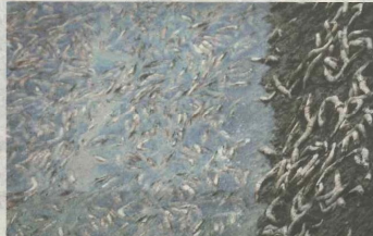
SEBAHAGIAN udang harimau yang mati akibat pencemaran Sungai Langat.