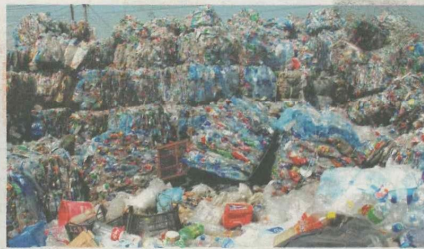
KEENGGANAN China menerima sisa pepejal plastik dari negara maju seperti United Kingdom dan Amerika Syarikat menyebabkan bahan buangan itu dibawa ke Asia Tenggara termasuk ke Malaysia.

Pihak berkuasa seperti Amerika Syarikat (AS), United Kingdom (UK) dan Australia telah pun menyatakan kekusaran mengenai sisa pepejal dari negara-negara berkenaan yang kini tidak