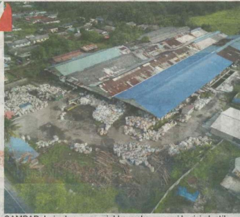
GAMBAR dari udara menunjukkan ratusan guri berisi plastik yang sedang menunggu dikitar semula di sebuah kilang di Jenjarom, Kuala Langat dalam tinjauan Kosmo! baru-baru ini.

"Pada awalnya kami mendapati sebanyak 12 kilang yang memproses sisa plastik di Kuala Langat. Namun,