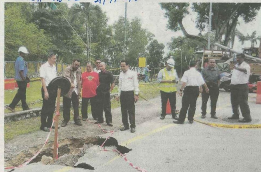
Bryan (dua kiri) bersama kakitangan agensi berkaitan sedang meninjau keadaan tanah mendap.

Beliau berkata, pihaknya mendapati saluran air kumbahan pada saluran