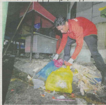
KONTRAKTOR melakukan kerja-kerja mengutip dan membersihkan sampah sarap di kawasan tapak bazar ramadan di Jalan Telawi, Bangsar selepas operasi perniagaan tamat.

Utusan Malaysia difahamkan, masalah sampah di tapak bazar kendalian pihak berkuasa tem-