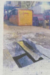
KEADAAN longgok yang terdapat sisa minyak masak terpakai dipercayai dibuang oleh peniaga di bazar ramadan Bandar Sri Permaisuri, baru-baru ini.