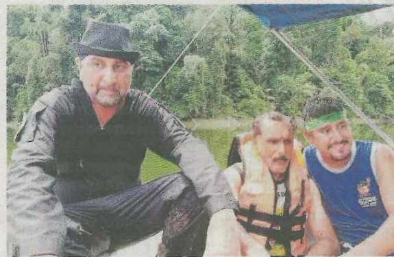
Mangsa (tengah) ditemui kira-kira jam 1.45 petang, semalam.