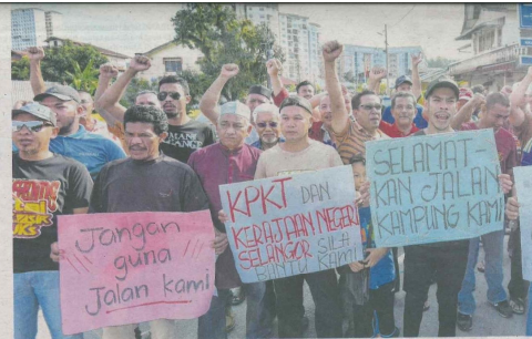
Penduduk bantahan kerja korek jalan kampung