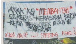
KAIN restang yang membantah 'pencerobohan' jalan di Kampung Pasir untuk pembinaan saliran paip ke Estana Court 2.