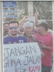
PENDUDUK Kampung Pasir, Hulu Kelang, Ampang membuat bantahan terhadap kerja-kerja pengorekan dan pemasangan paip air di Haji Zam Zam ke tapak pembangunan Estana Court 2, Welmaris.