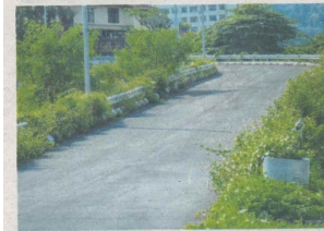
LALUAN menghubungkan Estana Court ke Taman Ulay Bistari yang masih