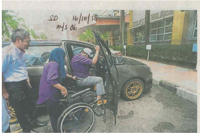
▲安邦医院有10个残障人士泊车位，方便残障人士驾车到医院就医。