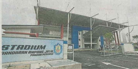
▲位于班登柏兰岭的安邦再也市议会体育馆甫于今年4月开

据我所知，楼上单位的业主已因不堪噪音干扰，宁愿减价抛售单位。我每晚已因噪音而难以入睡和休息，情绪和精神大受影响，希望当局能关注。”