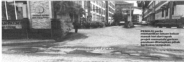
PEMAJU perlu memastikan laluan keluar masuk lori dari tapak projek mematuhi garis panduan ditetapkan pihak berkuasa tempatan.

UNIT BERITA KOTA 44, Jalan Utusan, Melalui Jalan Chan Sow Lin, 55200, Kuala Lumpur. Facebook: Utusan Kota Twitter: @UtusanKota Laman web: www.utusan.com.my