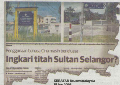
Penggunaan bahasa Cina masih berleluasa Inkari titah Sultan Selangor?

"Perihal ini turut mendapat perhatian Tuanku yang telah memberi titah dan nasihat agar kerajaan negeri memartabatkan bahasa Melayu dengan menetapkan hanya bahasa Melayu dalam papan tanda rasmi ker-