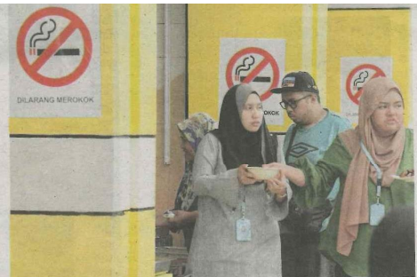
POSTER larangan merokok dipasang sempena pelancaran program Restoran Tanpa Asap Rokok dan Tembakau di Presint 9, Putrajaya semalam.