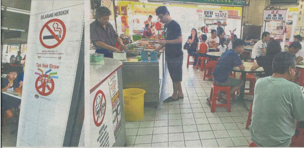
Some took less time than usual over their meal since they could no longer smoke on the premises.

"However, there are some teething issues that need to be ironed out, such as clear guidelines on the distance smokers need to be kept from restaurants."