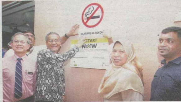
DZULKEFLY AHMAD (dua dari kiri) berama Zuraida Kamaruddin dalam Majlis Pelancaran Program Restoran Tanpa Asap dan Tembakau di Presint 9, Putrajaya, semalam. Turut hadir Timbalan Menteri Kesihatan, Dr. Lee Boon Chye (kiri).

"Kita tidak bermusim kerana dalam soal ini aktiviti penguatkuasaan dijalankan 24 jam setiap hari," katanya dalam sidang akhbar selepas Majlis Pelancaran Program Restoran Tanpa Asap dan Tembakau di Presint 9, di sini hari ini.