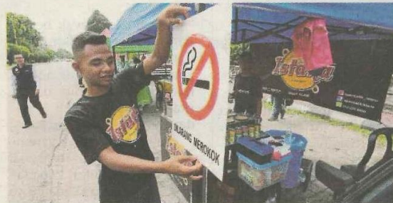
PENIAGA gerai makanan menampal papan tanda Larangan Merokok pada premis makanannya di Taman Rakyat.

sebenar papan tanda yang ditetapkan kementerian.