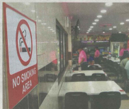
'No smoking' signs were seen at Restaurant Mahesha in TTDI at prominent places of the restaurant.

quick breakfast without staying to chat over a cup of coffee and a cigarette like they used to.