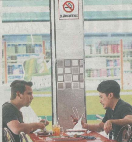
Aimee Curry House in Section 52, Petaling Jaya, has put up 'No smoking' signs all around its premises.

UM's Education Faculty is organising a Discover SPM Lit workshop from 8.30am to 1pm on Feb 23. The workshops will be conducted by a specialist from the Education Ministry and costs RM30 per person. For details, call 03-7967 5124 or email litmad.um@gmail.com or azaila@um.edu.my