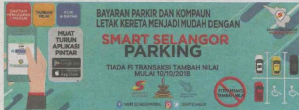
APLIKASI Smart Selangor Parking yang menghimpunkan beberapa perkhidmatan pembayaran parkir secara online di Selangor.