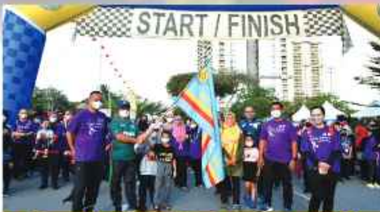
February's Car Free Day Program and MPAJ Level World Cancer Day Celebration

Pelbagai aktiviti telah diadakan seperti karnival ekspornasi jalan serta 10,000 langkah, zumba, aktiviti bercaskal, berjoging, pameran dan mini zoo. Terdapat juga pameran daripada agensi kerajaan dan swasta. Turut diadakan persembahan oleh Kumpulan Ibu Bapa dan Sokongan Anak-Anak Kanser (KIDS) penyerahan hadiah Anugerah Kajian Hijau anjuran PLANMalaysia kepada MPAJ dan Kebun Komuniti Pangsapuri Damara; penyerahan 'Malaysian Book of Record' larian paling jauh dalam tempoh 12 jam bagi Program Larian Mencari Nur pada 4 Disember 2021; Persembahan larian; serta sumbangan kepada Pangsapuri Kos Rendah Pandan Utama (Track C).