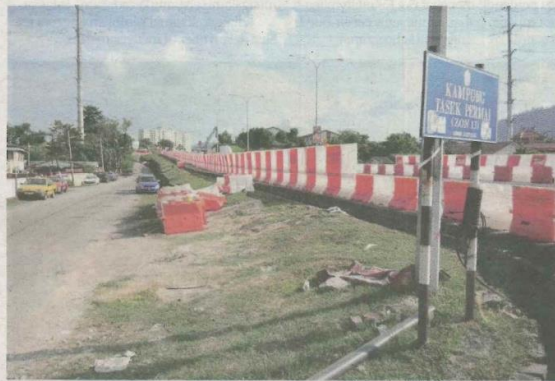
Sebahagian kon penghalang di sekitar kawasan perumahan.