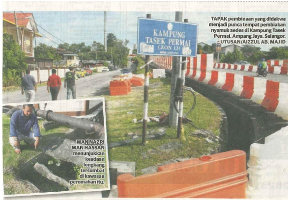
TAPAK pembinaan yang didakwa menjadi punca tempat pembiakan nyamuk aedes di Kampung Tasek Permai, Ampang Jaya, Selangor.