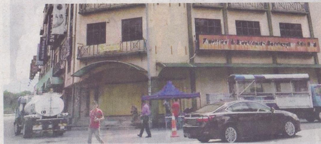
Lokasi Pusat Khidmat Setempat yang disediakan Syabas.