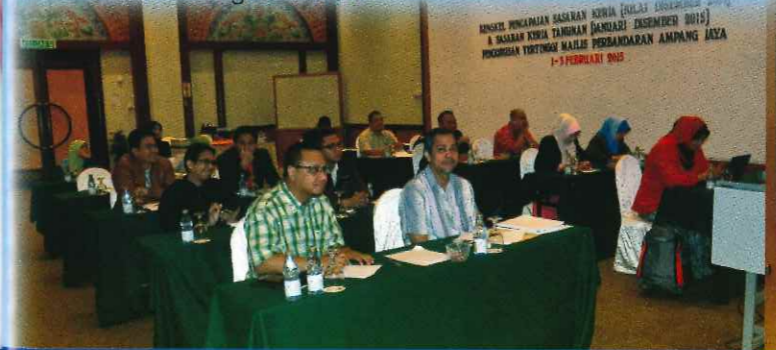
BENGKEL PENCAPAIAN SASARAN KERJA (JULAI DISEMBER 2014) & SASARAN KERJA TAHUNAN (JANUARI DISEMBER 2015) PENGURUSAN TERTINGGI MAJLIS PERBANDARAN AMPANG JAYA 1-3 FEBRUARI 2015

The 2015 Annual Work Target and 2014 Annual Work Achievement Workshop was held from 1 until 3 February 2015 at the Awana Hotel, Genting Highland. The workshop focused on the performance and achievement in 2014 for each department. Weaknesses were identified together with the cause of problems in order to make new strategy for the following year. Based on 2014 weaknesses, a proper plan was conducted on the 2015 annual work targets to achieve the mission and vision of MPAJ in accordance with MPAJ Strategic Plan 2015-2020.