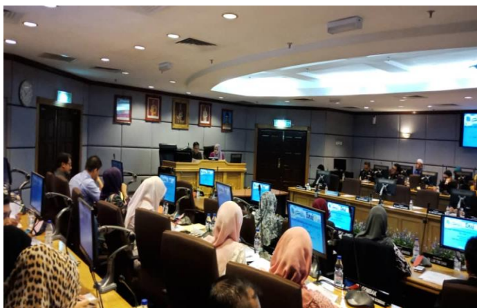
Mesyuarat Induk SSM